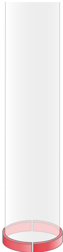
Säulenringe in zwei Teilen

Rundbögen und Säulenringe werden mit ca. 10 cm gerade auslaufenden Enden produziert und können somit vor Ort optimal angepasst werden.